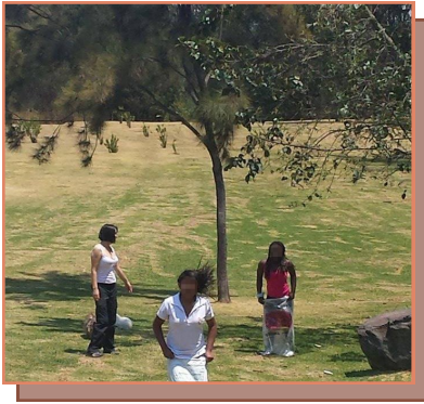
Jugando al ensacado, Parque Metropolitano. Agosto 2014

El día 7 de agosto del presente año, las usuarias de la Casa de Protección, realizaron una salida recreativa al Parque Metropolitano, donde estuvieron en contacto con la naturaleza. Además se realizaron actividades lúdicas y de entretenimiento donde las Usuaris pudieron tener un tiempo de esparcimiento y reencuentro con el juego.