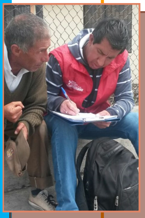
Promotor realizando un abordaje, sector Av. Del Maestro