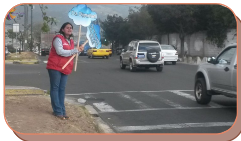
Sensibilización en Calles en la Av. De la Prensa

diferentes sectores de las zonas 1,2 y 3 del DMQ.