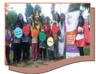
Campamento Móvil en Av. De la Prensa.

promiso y apoyo de los padres y madres asisten los NNA al campamento donde reciben además información sobre los riesgos del Trabajo en la calle, y mecanismos de protección. El equipo lleva alegría, juegos, dinamismo y un mensa-